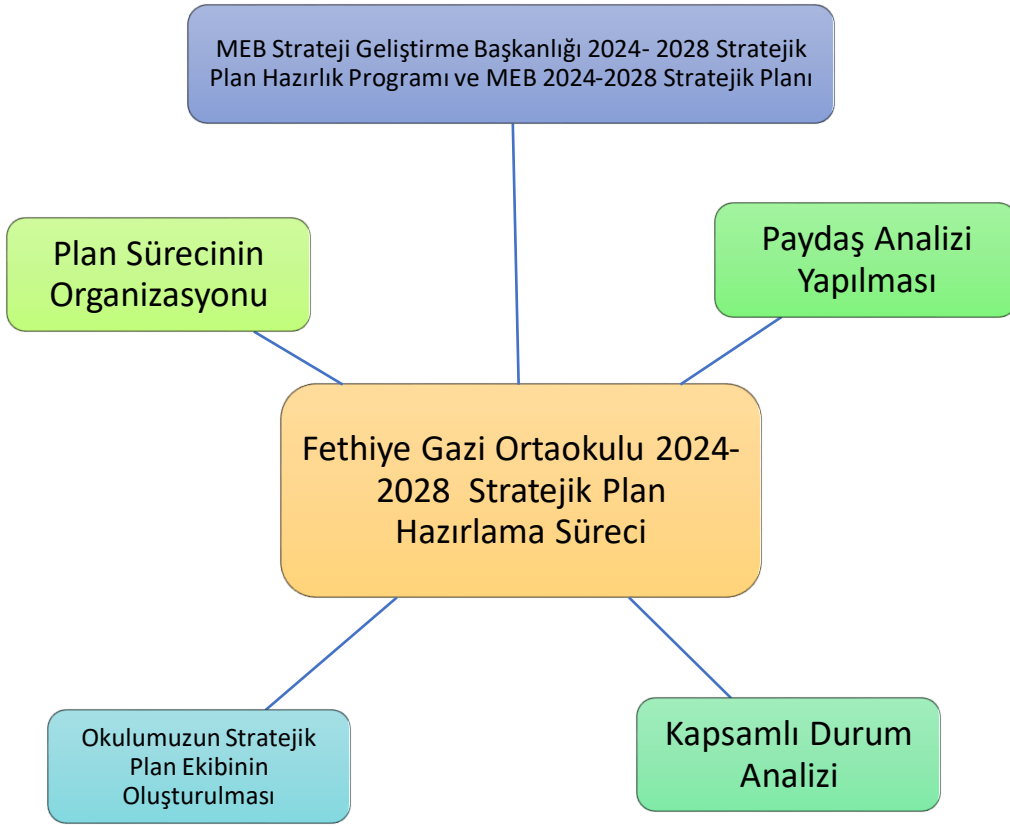
Şekil 1. Planlama Süreci